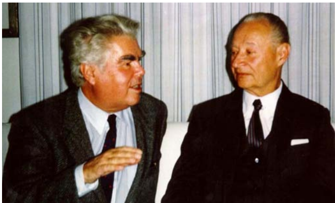
Jiří Pelikán e Alexander Dubček nel loro incontro a Bologna.