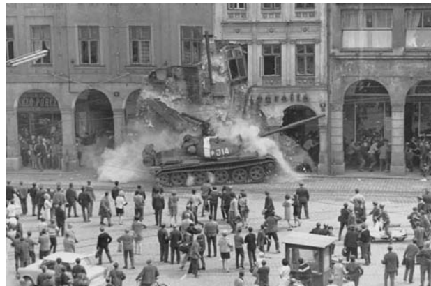
Un carro armato sovietico fuori controllo in una piazza di Liberec. Due persone morirono sotto le macerie.

Fernando Orlandi (Biblioteca Archivio del CSSEO) – Pechino: dall’invasione della Cecoslovacchia all’apertura agli USA