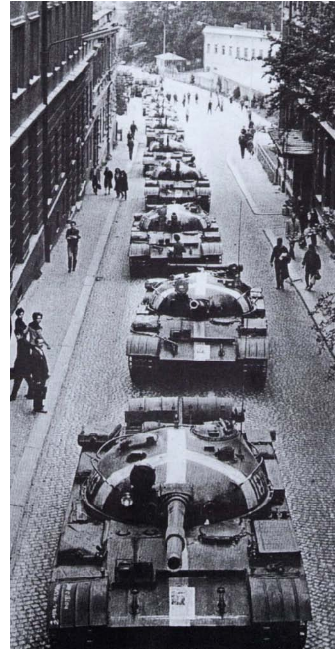
Carri sovietici a Liberec (Boemia settentrionale, vicino al confine con la Germania).