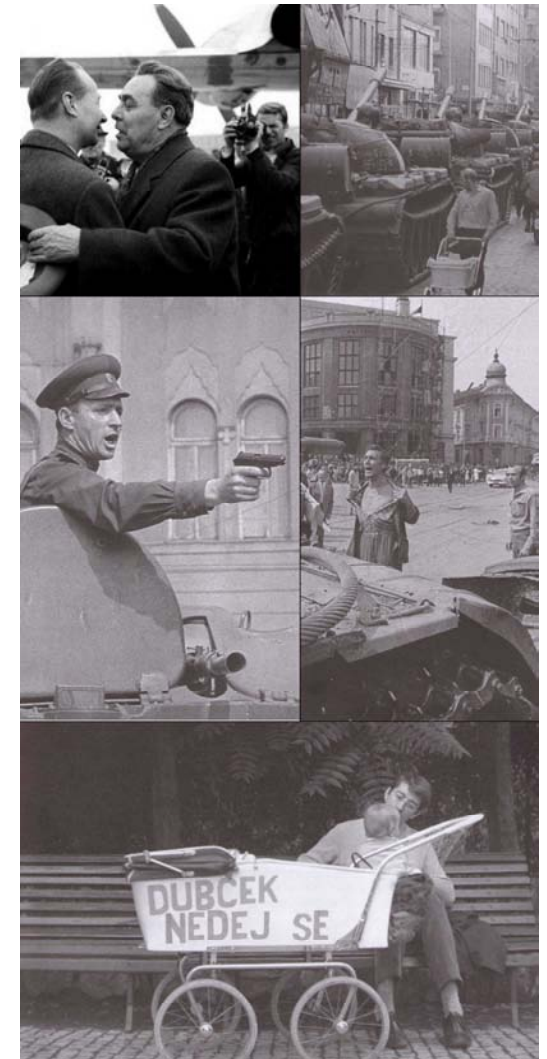
Sulla carrozzina: "Dubček non arrenderti"

I lavori del convegno si terranno a Levico Terme, presso la sede della Biblioteca Archivio del CSSEO (Via Stazione 16).